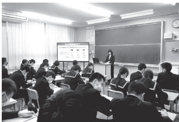
税金についての理解を深めました

12月3日、八峰中学校3年生を対象に租税教室が行われました。 次世代を担う生徒が、税とはどのようなものか、どんな役割があるかを正しく理解し、税金の必要性を考えようという目的で開催されました。 この日は、町税務課職員を講師として「私たちの生活と税金」をテーマに、グループワーク形式の授業や1億円レプリカを持つ体験などが行われました。授業を受けた生徒からは、「税金が身近でたくさん使われていることがわかったので、大切にしたい」などの感想がありました。