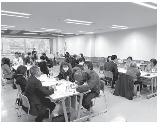
町ならではの体験を話し合いました

今後は、委託先コンサルタント「さとゆめ(本社・東京都)」が、寄せられたアイデアを元にモニターツアーを企画し、12月に実施する予定です。