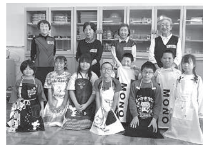
世界にひとつだけのエプロン完成!! (八森小)