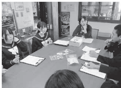
町文化祭に向けた地元企業との打ち合わせ (八峰中)

今回は、2学期の学習活動の中から、「子どもたちのがんばり+地域の応援」がひとつになった場面をスナップで紹介します。写真から、子どもたちの満足感と充実感を感じ取っていただければ幸いです。