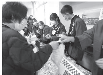
大盛況の町文化祭での販売活動 (八峰中)